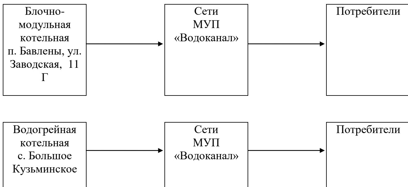
Рисунок № 1

Схема теплоснабжения Бавленского поселения от источников тепла представлена на рисунке № 1